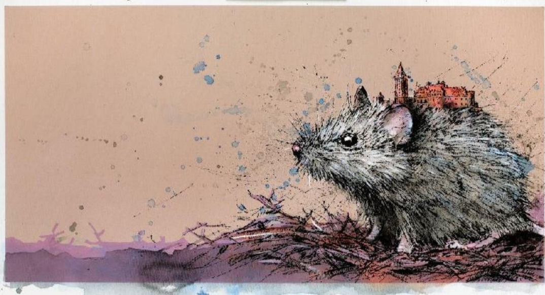
Graf. Pobrana z sieci, domena publiczna.