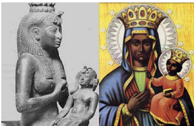
Graf. Pobrana z sieci, domena publiczna

Być może ze względu na taki, a nie inny sposób przedstawiania Izydy, wiele osób widziało w niej wzór chrześcijańskiego kultu Maryi.