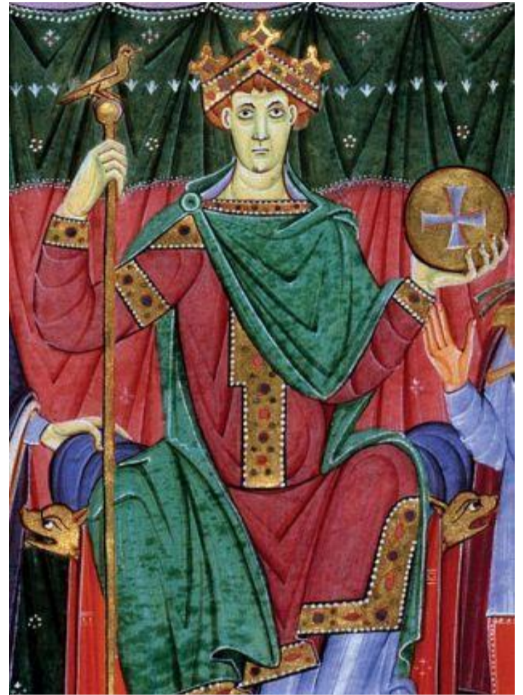
Graf. Pobrane z sieci, domena publiczna.